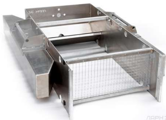
ЛАРН 32 ©