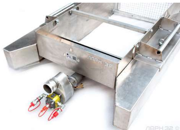
ЛАРН 32 ©